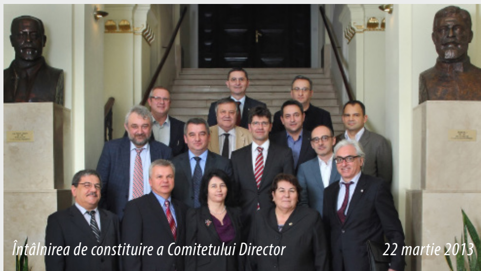
Întâlnirea de constituire a Comitetului Director